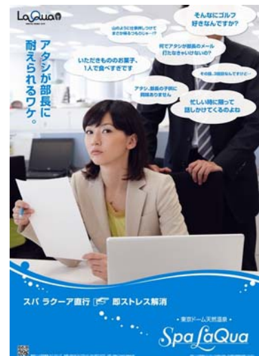
スパ ラクーア ポスタービジュアル