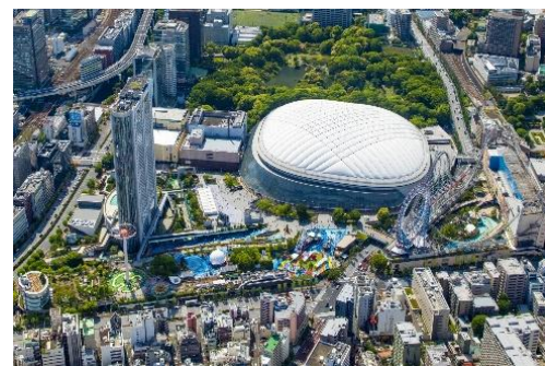
東京ドームシティ