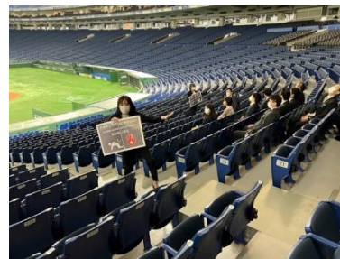
イメージ(過去の訓練の様子)