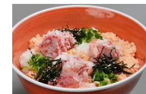
【かにトロ丼】 大漁市場なかうら (鳥取県)