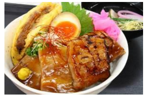
【志布志黒豚三味丼】 志布志黒潮隊 (鹿児島県)