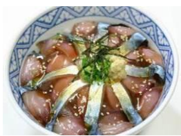
【八戸銀サバづけ丼】 日本で唯一のサバ料理専門店 サバの駅(青森県)