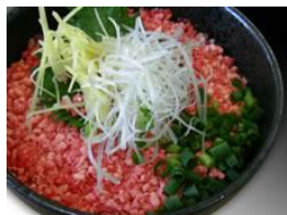
【新・牛とろ丼】 十勝・牛とろ丼 (北海道)

ご来場のお客様は、どんぶり引換チケット(1枚500円)を購入し、チケットとお好きなどんぶりを引換えます。どんぶりを食べ比べ、本選に出場してほしいどんぶりをひとつ選び、引換チケット購入時に1人1枚お渡しするコインで投票します。投票数上位の10どんぶりは2013年1月12日(土)～20日(日)の9日間東京ドームで開催する『ふるさと祭り東京2013』の「第4回ご当地どんぶり選手権」への出場権を獲得します。