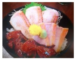
【小田原とろ金目鯛の三宝丼】 小田原どん (神奈川県)