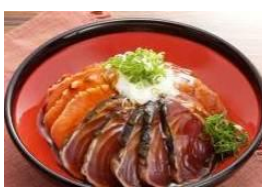
【土佐漁師の三色丼】 明神水産 (高知県)