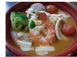
【白子流フイヤーベース丼】 かわごえ (千葉県)