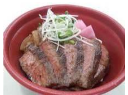
【米沢牛ステーキ丼】 米沢 琥珀堂 (山形県)