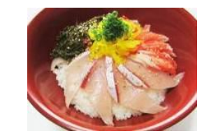
【ザ・プリ丼】 すし王国能登七尾.松乃鮨 (石川県)