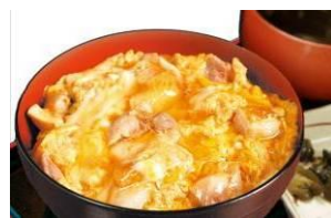
【比内地鶏親子丼】 秋田比内や(株) (秋田県)