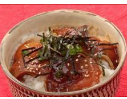
【がんこ漁師の熱めし丼】 かまえ直送活き船団 (大分県)