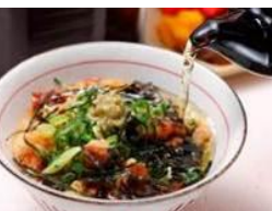
【鰻まぶし丼】 鰻ま屋 (愛知県)