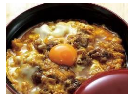
【名古屋コーチン親子丼】 鳥開 (愛知県)