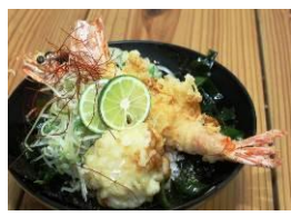
【天然足赤えび天丼】 漁協食堂うずしお (徳島県)