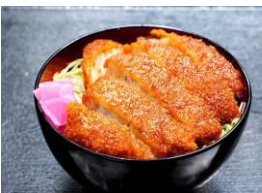
【ソースかつ丼】 ソースかつ明治亭 (長野県)