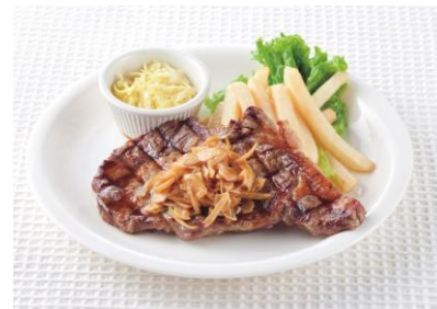
コアウッズステーキ

ベースボールカフェの夏といえば、このステーキ。人気ナンバーワンのガーリック醤油ソースが食欲をそそります。