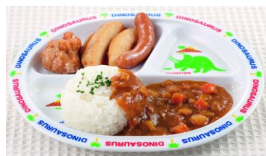
【ビッキーズ】 お子様カレー 820円