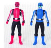
ヒーロー人形 (イメージ)

※その他店舗(ホットドッグ スタンド、フェスタカフェ、バルコ)でもメニューをご用意しています。 ※店舗・メニューにより、人形の色や種類は異なります。