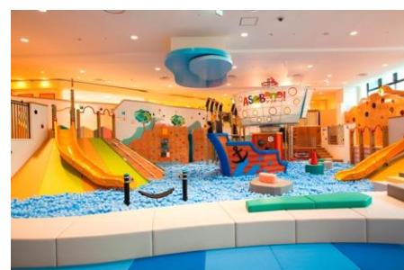
アソボ～ノ！館内(アドベンチャーオーシャン)