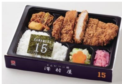
澤村拓一選手プロデュース 【昭和六十三年創業 とんかつ一筋 澤村屋】

お客様からのお問い合わせ先:東京ドームシティ わくわくダイヤル TEL. 03-5800-9999