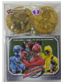
ゴーバスターズせんべい 500円