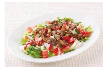
“プルメリア”ビーフサラダ

ハワイを代表する花のひとつ「プルメリア」。野菜とビーフをふんだんに使用した、プルメリアをイメージしたサラダです。