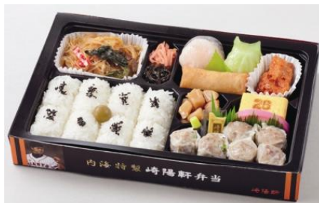
内海哲也選手プロデュース 【内海特製 崎陽軒弁当】