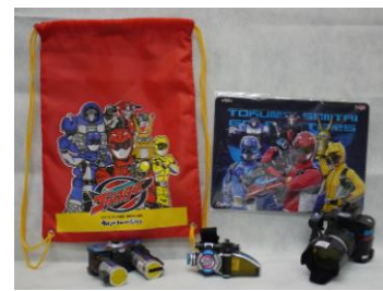
ヒーローバッグ 2,000円