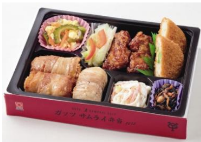
小笠原道大選手プロデュース 【ガッツ サムライ弁当 2012】