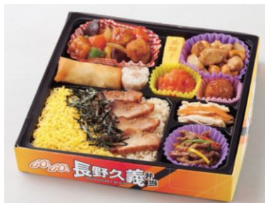
長野久義選手プロデュース 【GO! GO! 長野久義弁当】