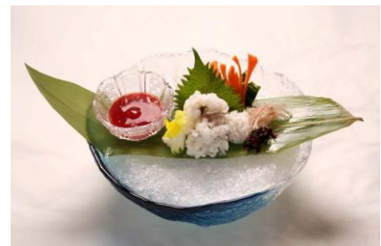
鱧ちり造り(イメージ)

鰹で取ったダシと蟹から出るダシのダブルスープで、濃厚かつ上品な味に仕上げました。