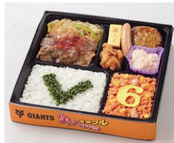
坂本勇人選手プロデュース 【ミラクル 6 2012】