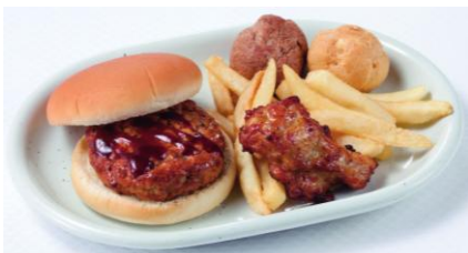
【ベースボールカフェ】 キッズバーガー 820円