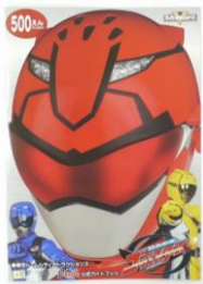
公式ガイドブック 500円