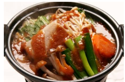
羅臼産ほっけのちゃんちゃん焼き(イメージ)