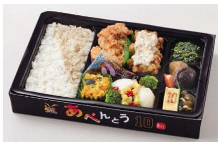
阿部慎之助選手プロデュース 【最高です!!あべんとう 2012】