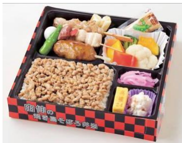
高橋由伸選手プロデュース 【由伸の焼き鳥そぼろ弁当】