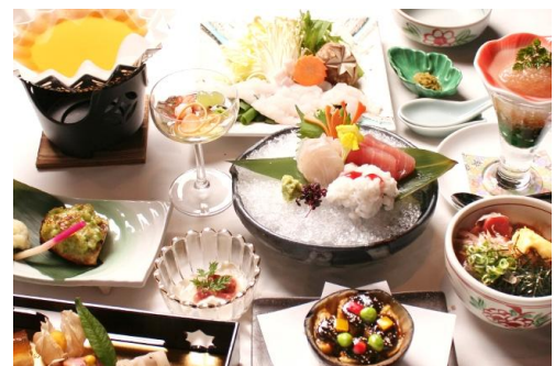
「鱧と京懐石」コース(イメージ)

お客様からのお問い合わせ先:スパ ラクーア フロント TEL. 03-3817-4173