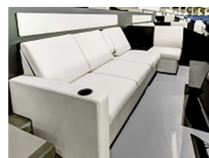
THE 3rd プラチナボックス