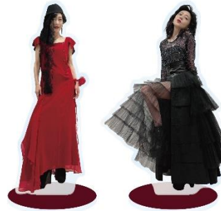
アクリルスタンド イメージ

■お客様からのお問い合わせ先:東京ドームシティ わくわくダイヤル TEL.03-5800-9999