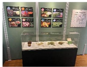
上段の左から、序章、第1章、第2章、 下段左から、第3章、第4章、第5章、それぞれの展示イメージ ※2023年、ミュージアムパーク茨城県自然博物館における展示より

※会期・開館時間・内容が変更になる場合がございます。最新の状況は、公式ホームページや公式Xをご確認ください