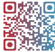
Google Play QR コード

※コミュニティトークン(CT)は「FINANCiE」において活動するプロジェクトが発行するデジタルアイテムを指します。有価証券や暗号資産には該当しません。