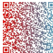
App Store QR コード

https://play.google.com/store/apps/details?id=jp.finance.ichiba